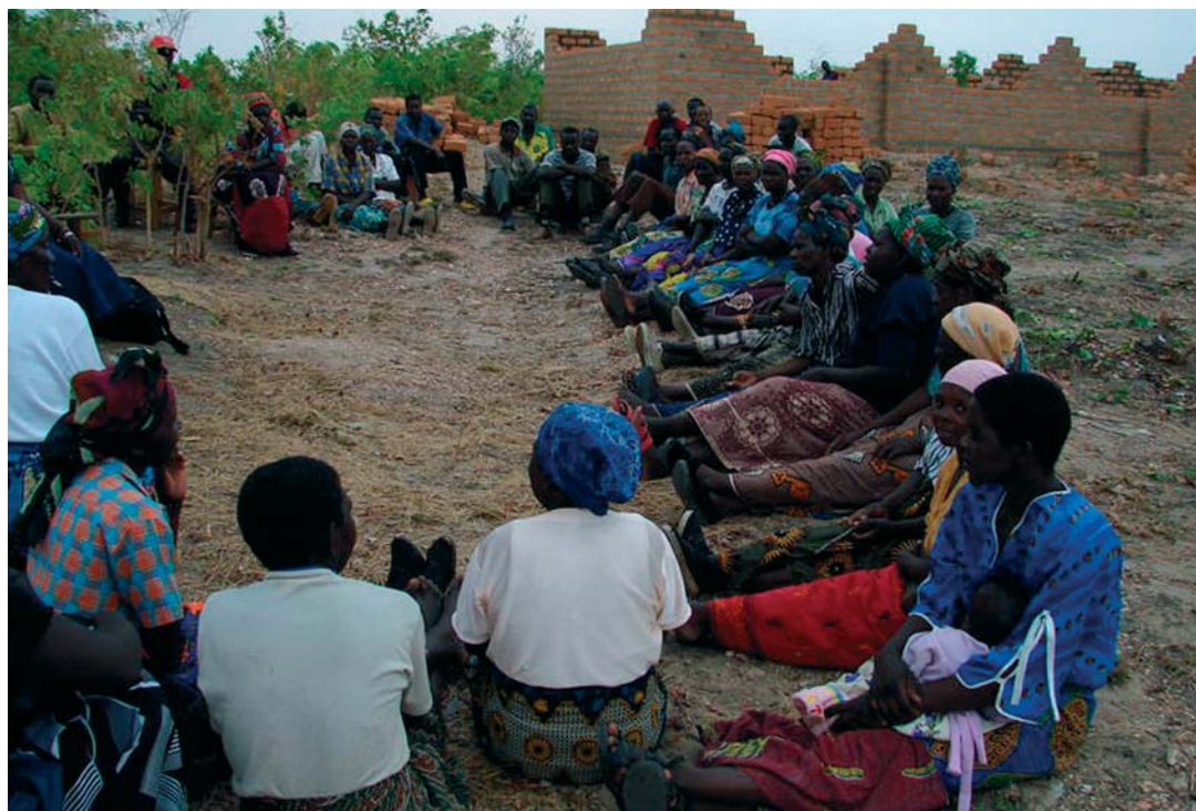
Przedstawicielki lokalnej społeczności oraz reprezentanci Women For Change rozmawiają o sukcesie, jaki jedna z miejscowych kobiet odniosła w wyborach do władz lokalnych. Madzubuka, Zambia.

sprawach. Zdecydowano, że jest to najlepsze miejsce do rozważań nad kwestiami równości oraz przekazywania młodym wiedzy o konsekwencjach, jakie przynosi dyskryminacja. Udało się w ten sposób zredukować negatywne praktyki, między innymi przemoc wobec kobiet usprawiedliwianą 'opłatą ślubną' dla ojca panny młodej, czy ograniczanie możliwości poruszania się dla dziewcząt w wieku szkolnym.