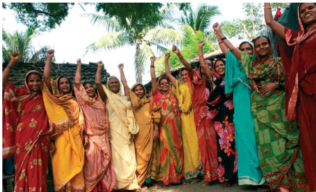
Przedstawicielki lokalnej organizacji na rzecz praw kobiet w Murshidabad, Indie.

WFC, aby zrealizować swoje cele włącza w swoje działania mężczyzn. Dla przykładu, po jednym z warsztatów uwrażliwiających mieszkańców na potrzeby i pozycję kobiet w społeczności chłopcy i mężczyźni z wioski w dystrykcie Lundazi we wschodniej Zambii, zdecydowali się promować równość płci przez instytucje „ mphala ”. Mphala to nieformalne wieczorne spotkania, na których męska część wioski dyskutuje o ważnych dla społeczności