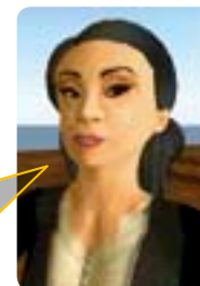
SIU MEGKÉRTE, HOGY NE HASZNÁLJUK VALÓDI NÉVÉT, ÉS NE MUTASSUK AZ ARCKÉPÉT, MERT NEM SZERETNÉ, HA FELISMERNÉK.